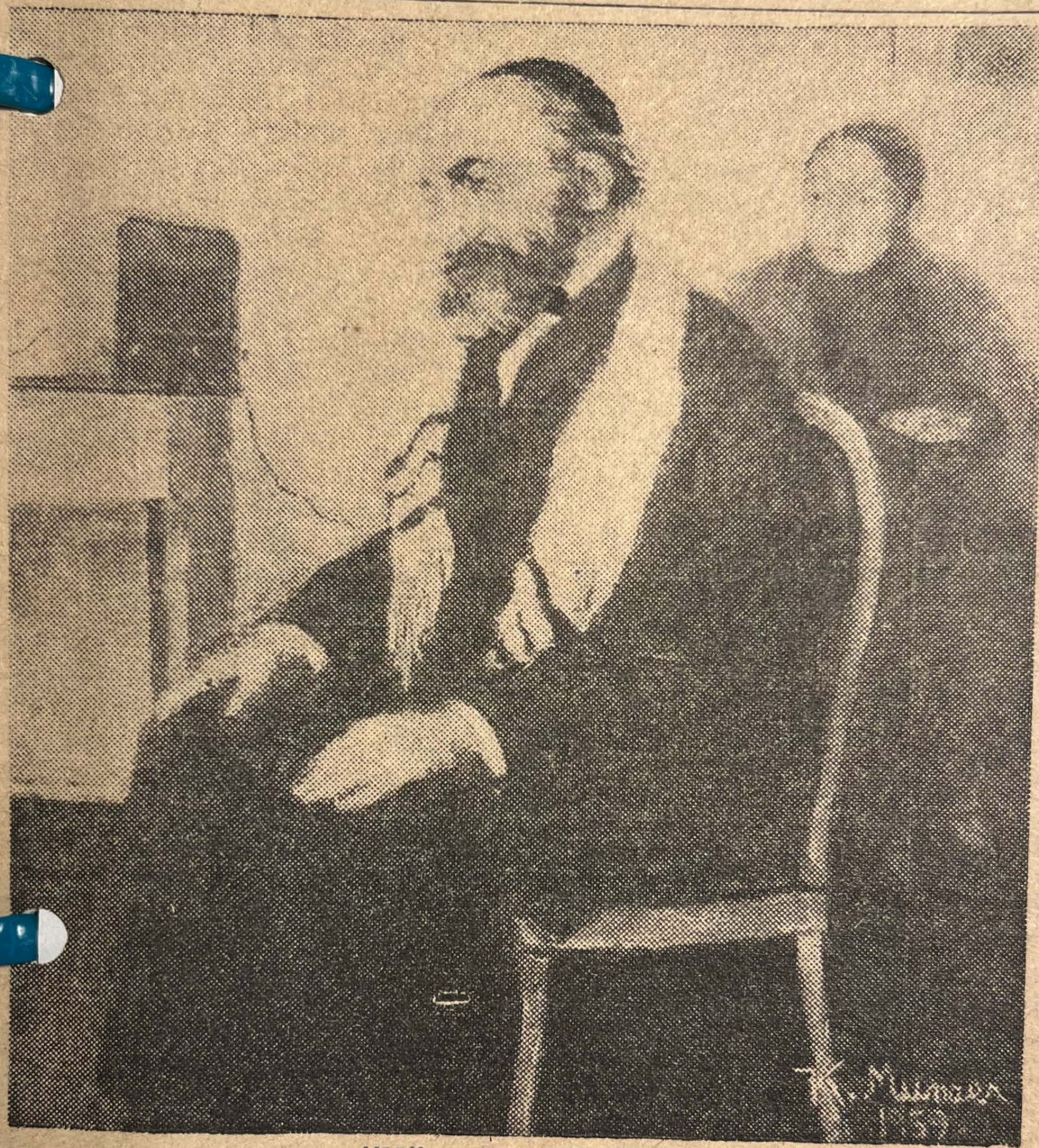
"Höre Israel —"

verstorben sein und 9 auf dem|schöne Zeit) nach Strich und Fa-